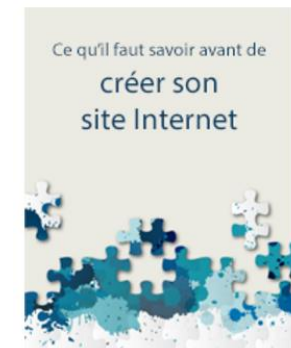
Créer son site Internet