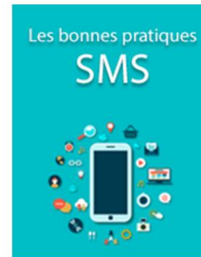
Les bonnes pratiques SMS