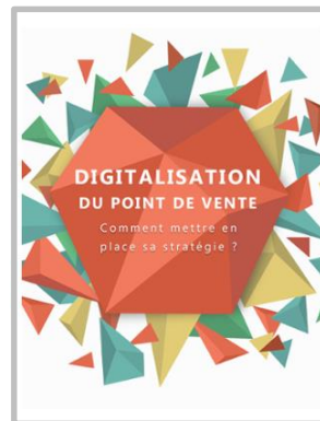
Digitalisation du point de vente